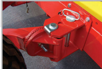
Altezza ruote regolabile Hauteur roues réglable Adjustable wheel height Verstellbare Radhöhe Altura de ruedas regulable