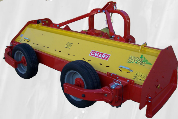
Trinciastocchi per grandi dimensioni Broyeur pour grandes surfaces Choppers for big surfaces Mulchgeräte für grosse Flächen Cortadora para superficies vastas