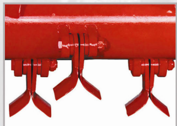
Coltelli a Y Fléaux Y Y-flails Y-Messer Cuchillas Y