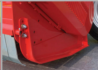
Slitte regolabili Patins réglables Adjustable skids Verstellbare Kufen Patines regulables