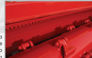
Doppia centina Double blindage Double rib Doppelblech Costilla doble