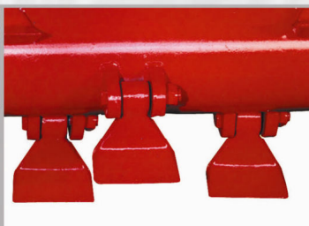
Martelli Marteaux Hammer blades Hammerschaufeln Martillos