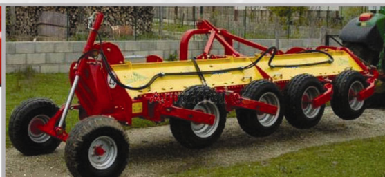
Trasporto idraulico Transport hydraulique Hydraulic transport Hydraulischer Straßentransport Transporte hidráulico