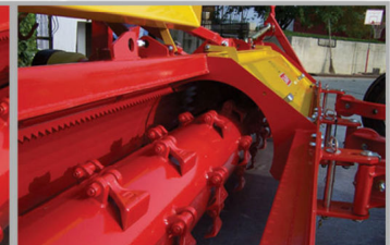
Monrotore Monorotor Monorotor Einrotor Monorotor