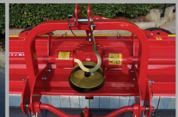
Sistema di trasporto su strada Dispositif transport sur route Road transport system Straßentransportsystem Sistema de transporte por carretera